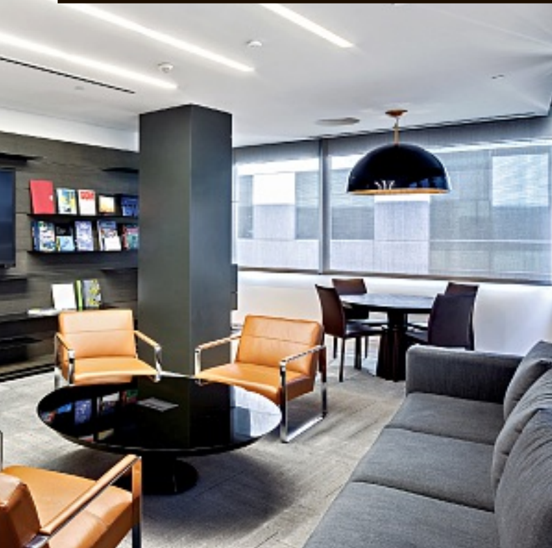
► Algunas lámparas producen vistosos acentos.

Los muebles que complementan la propuesta destacan por sus líneas sencillas que se integran adecuadamente a la arquitectura. En ellos lucen elementos metálicos, divisiones de cristal y acentos de color que pueden observarse en las cubiertas de madera oscura y en los asientos rojos.