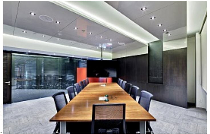
► Líneas sencillas y colores neutros destacan en el interiorismo.